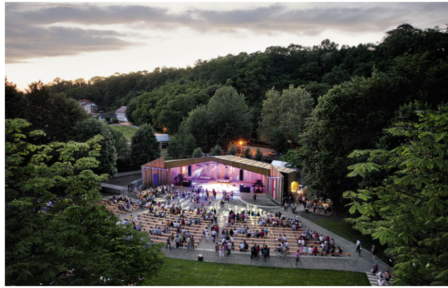
Die Freilichtbühne am Tag der Einweihung mit ganz geöffneten Toren.