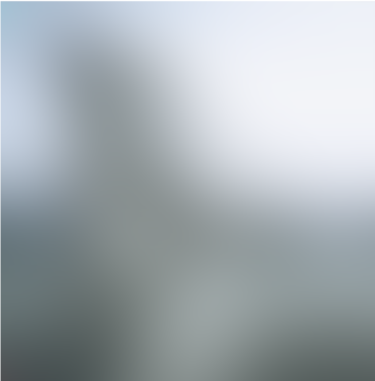
Das Opern-Dubai-Projekt in den Vereinigten Arabischen Emiraten.

Zeichnungen: Ateliers Jean Nouvel, Paris