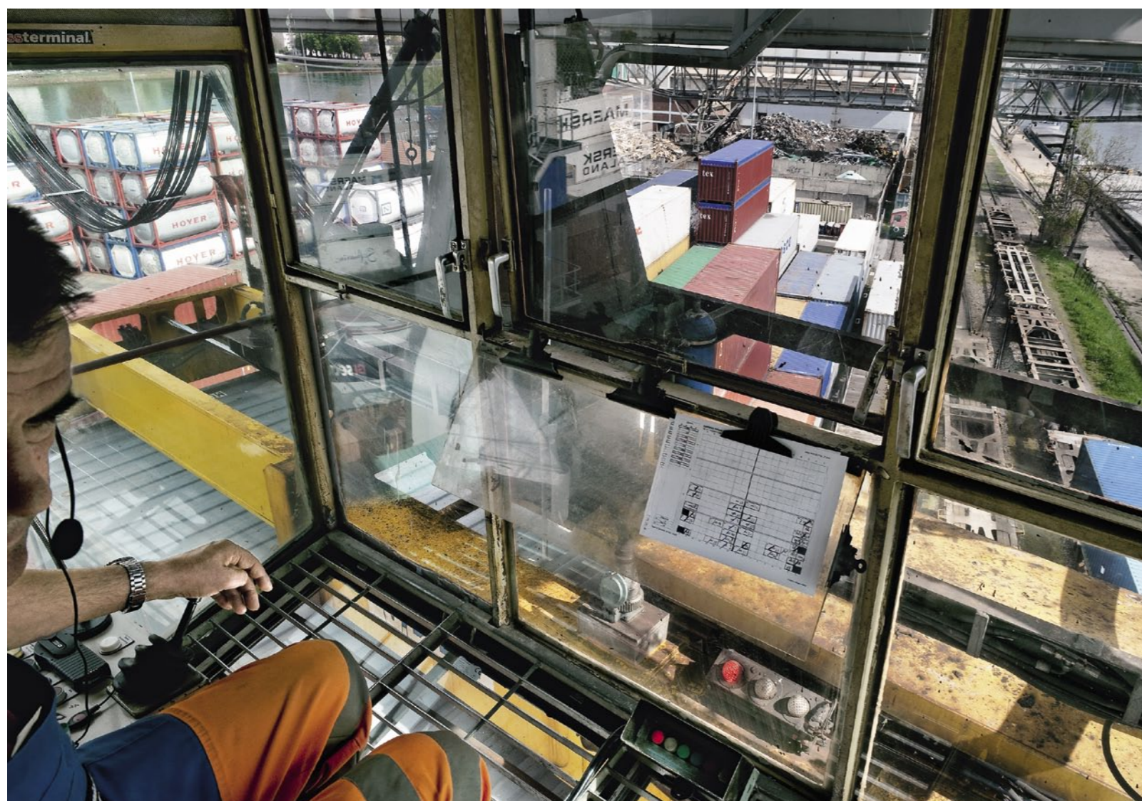
Hafenanlage auf der Schweizer Seite, künftiger Standort für 3Land