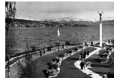
Freibad Allenmoos, Zürich, 1935–39 (oben); Farbengarten der Schweizerischen Landesausstellung in Zürich 1939.