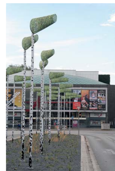
Platzgestaltung oder nur ephemere Spielerei? Birkenwald auf dem Aegi.