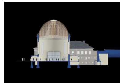
Der ambitionierte Wettbewerbsentwurf von JSWD Architekten aus dem Jahr 2000 (rechts) musste kräftig Federn lassen. Dem Unesco-Welterbestatus des Kölner Doms zuliebe ließ man die Hochhauspläne fallen; und die Deutsche Bahn hat die „große Lösung“ beim Ausbau des Deutzer Bahnhofs aufgegeben: Statt eines neuen riesigen Glasdachs gibt es erst einmal nur eine sanierte Kuppel (oben).