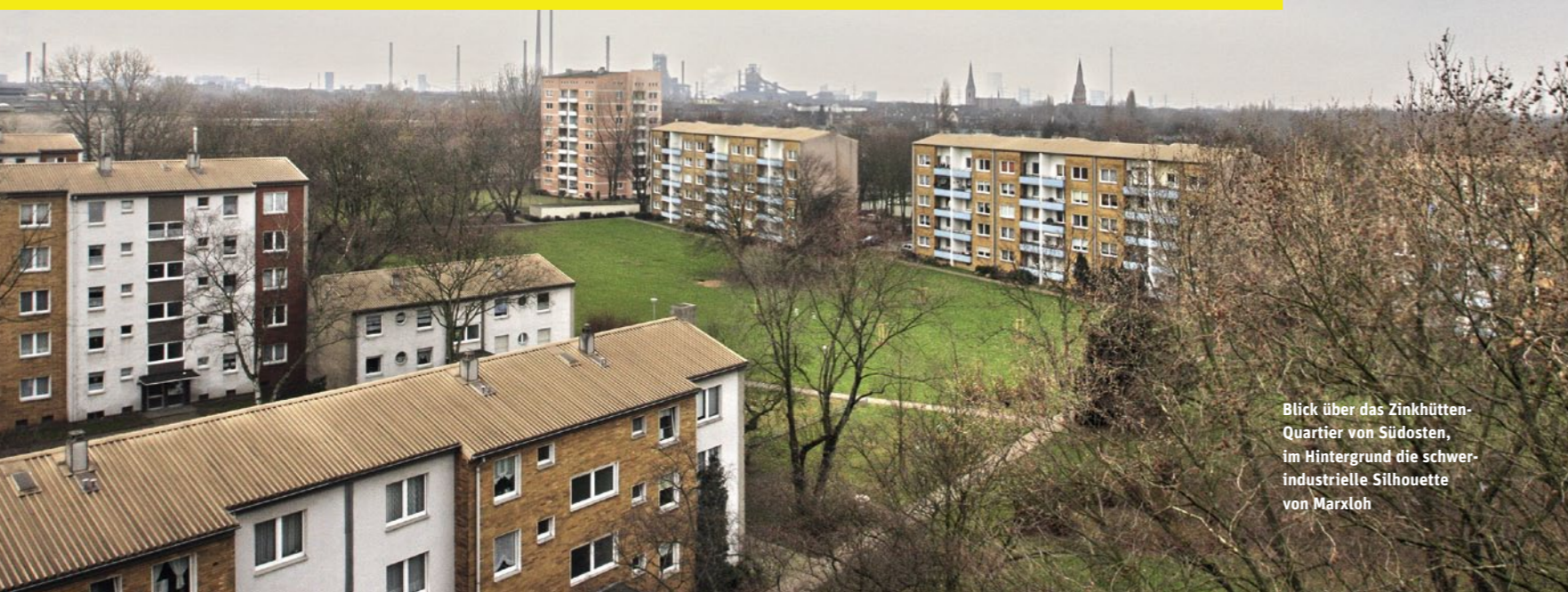
Blick über das Zinkhütten-Quartier von Südosten, im Hintergrund die schwerindustrielle Silhouette von Marxloh

Nach dem gründerzeitlichen Bruckhausen soll nun ein Stadtquartier der fünfziger Jahre verschwinden. Geplant von keinem Geringeren als Max Taut, steht es den wirtschaftlich optimalen Voraussetzungen eines niederländischen Investors im Weg, der hier gern mit einem Factory-Outlet-Center Geld verdienen möchte. Die Stadt ist dumm genug, darin einen probaten Weg hin zu einer nachhaltigen Entwicklung zu sehen. Die Duisburger Skandalchronik wird lang und länger.