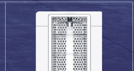
Verschiedene Optiken und Hybridvarianten mit LEDs sorgen für optimale Beleuchtung am Arbeitsplatz.