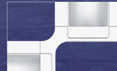
Direkt/Indirekt-Leuchte ELEE A mit höchsten Wirkungsgraden und Beleuchtungsflexibilität Design: Ingenhoven Architekten

Intelligente Lichtlösungen von Zumtobel sind in perfekter Balance von Lichtqualität und Energieeffizienz – in HUMANERGY BALANCE.