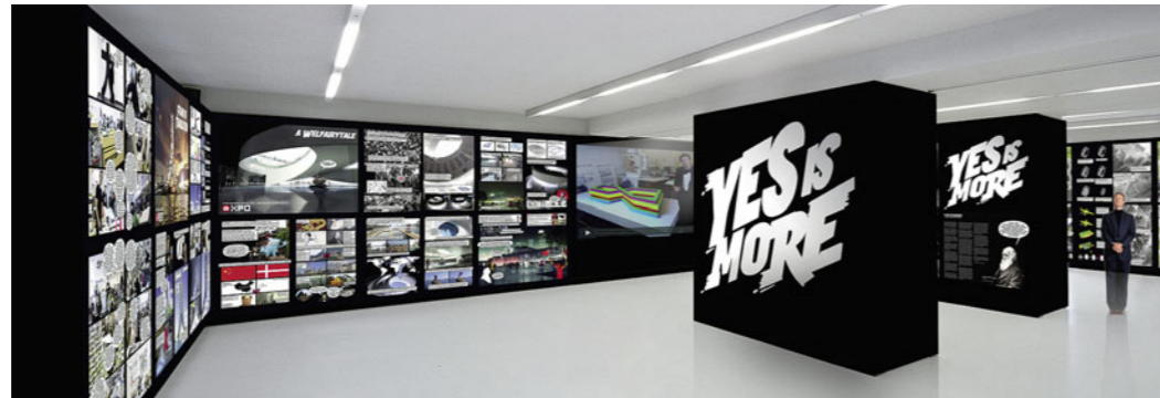
Architekturcomic auf Stellwände aufgezogen Visualisierung: BIG

BIG wäre nicht BIG, würde sich das Büro konventionell mit Texten, Zeichnungen und Visualisierungen präsentieren. Die Grundlage der Wanderausstellung, die zurzeit im Stuttgarter Wechselraum Station macht, bildet die 400 Seiten starke Büromonografie, die als Architekturcomic konzipiert ist. Jedes Projekt wird von einem Protagonisten „erzählt“. So erläutert die Kleine Meerjungfrau den dänischen Expopavillon in Shanghai (Bauwelt 23), ein fiktiver Bewohner des Kopenhagener VM-House (Bauwelt