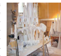
Blick von der 60 m hohen Plattform auf den Torre Agbar von Jean Nouvel. In der Modellwerkstatt und im Baubüro der Sagrada Familia.