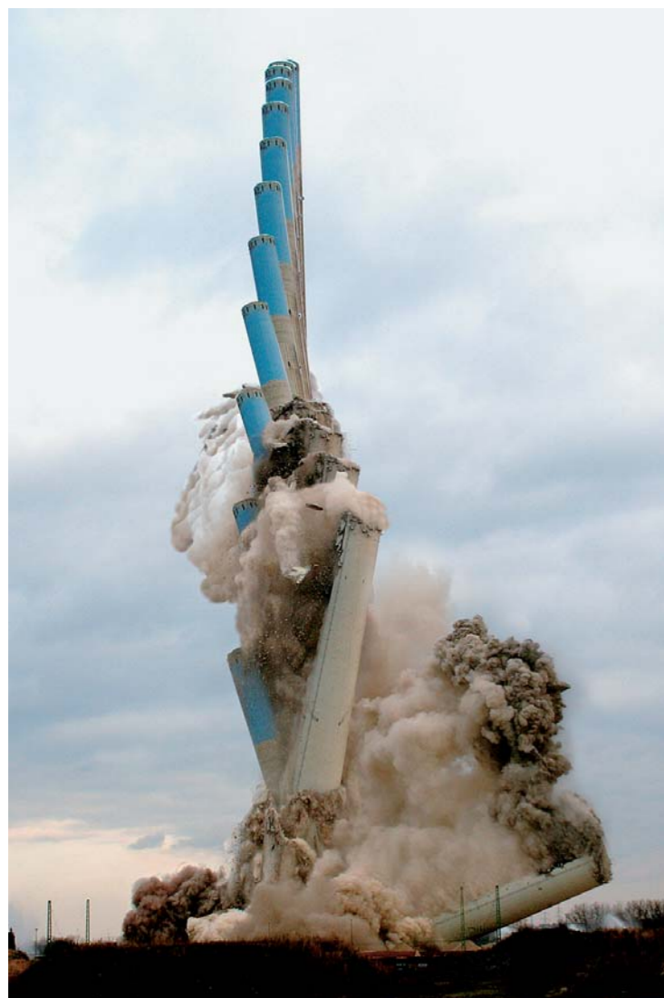
Sprengung des 300 Meter hohen Stahlbetonschornsteins des E.ON-Kraftwerks Westerholt in Gelsenkirchen-Hassel am 3. Dezember 2006.