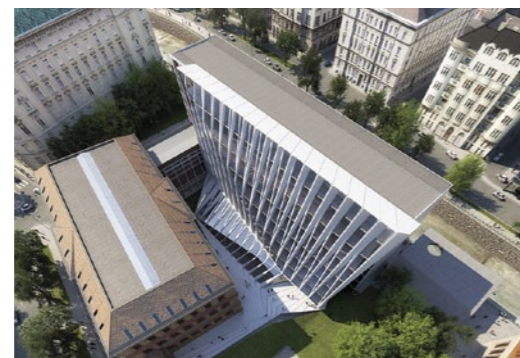
nicht prämiert | Zaha Hadid Architects