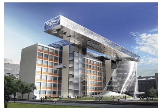
2. Rang | Coop Himmelb(l)au