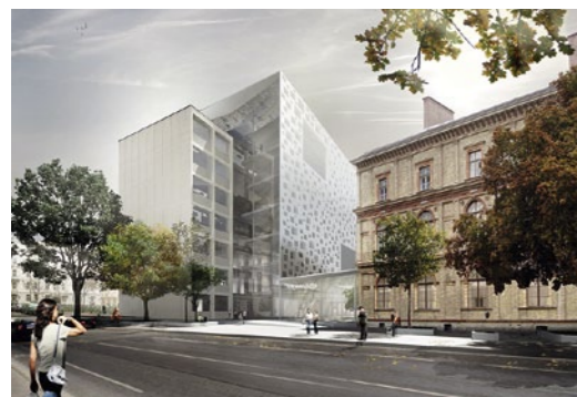
nicht prämiert | Staab Architekten

Schnitt i. M. 1 : 500; Modellfoto: Hans Lechner