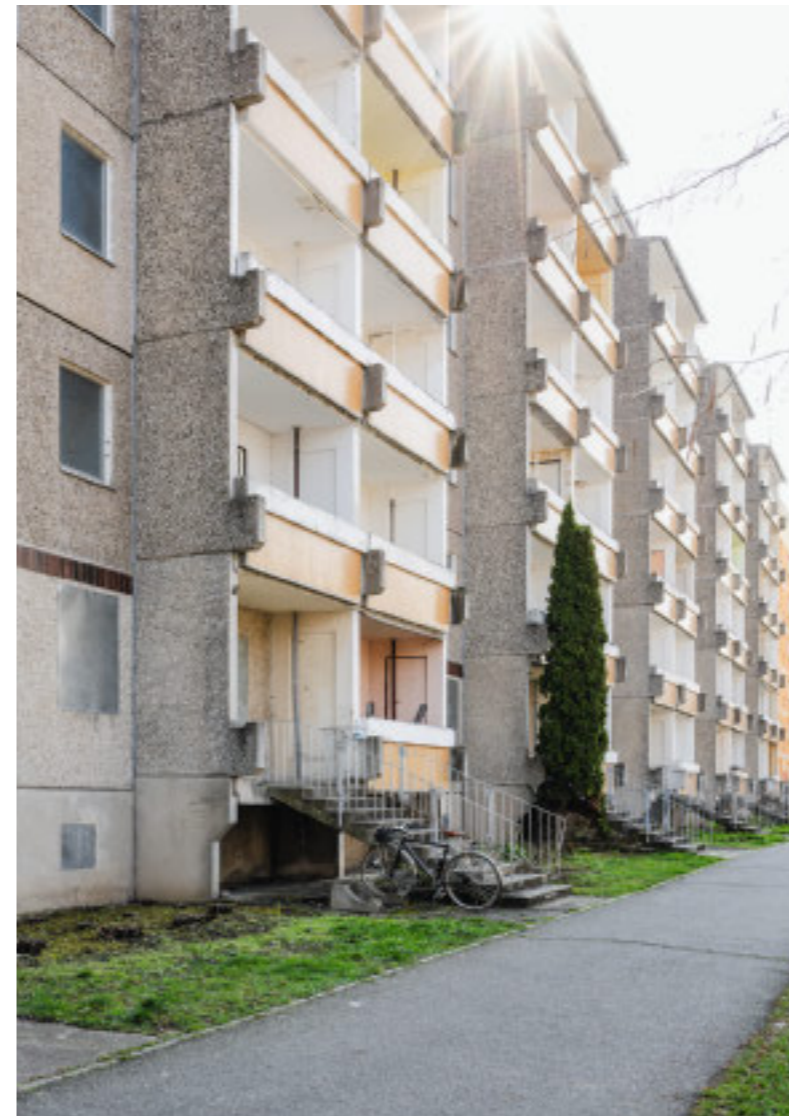
Im Rahmen des Forschungsprojekts „Nukleuswohnen“ richtet der Lehrstuhl für Wohnungsbau der RWTH Aachen einen Grünauer WBS70-Plattenbau zum Probewohnen her.

Gerade jetzt, wo wir wieder verstärkt über Verdichtung, bezahlbares Wohnen und lebenswerte Nachbarschaften sprechen, lohnt es sich, diese Qualitäten neu zu betrachten. Grünau ist deshalb nicht nur ein Gegenstand der Erinnerung, sondern auch ein Möglichkeitsraum für gegenwärtige Debatten.