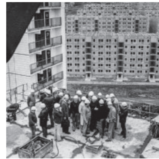
Links: Viele Schlüssel für die Wohnungen in den Plattenbauten im neuen Ost-Berliner Wohngebiet Ernst-Thälmann-Park, 1984. Oben: Plattenbau in Dresden-Gorbitz, August 1982

exzellente Konstrukteure wie sozial motivierte Planer all ihr Wissen und ihre Kreativität einsetzen. Ästhetische Sackgassen (Monotonie) oder sozialplanerische Hybris (Schlafstädte) werden keineswegs ausgespart, trotzdem überwiegt der Eindruck einer großen gesellschaftlichen Suche nach einem besseren Leben. Für alle!