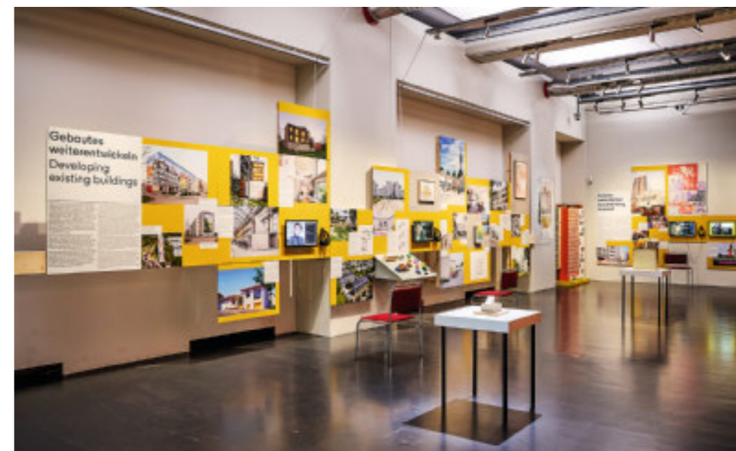
Platte Ost/West. Wohnen und Bauen in Großtafelbauweise

An diesem jüngsten Paradigmenwechsel wäre dann wirklich ein Wendepunkt aller bisherigen Modernisierungsvarianten erreicht. Aus den umstrittenen Neubaubeständen müssen endlich Altbauten werden, die pragmatisch, von ideologischem Ballast befreit, auf veränderte Nutzerbedürfnisse reagieren dürfen. Bei der Mietskaserne hat es achtzig Jahre gedauert, bis aus gründerzeitlichen Armutsvierteln heute gesuchte Wohnlagen für Besserverdiener wurden. Eine solche, wenn auch schlichtere Normalisierung wäre der Platte dringend zu wünschen.