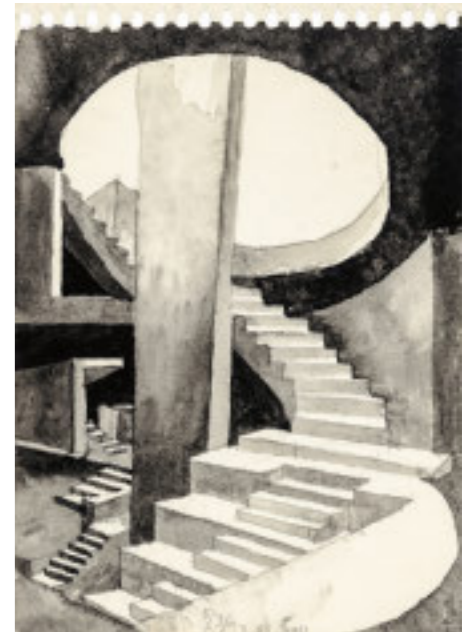
Zeichnung zum Kiasma Museum für zeitgenössische Kunst in Helsinki, das 1998 realisiert wurde und an ein fließendes Band erinnert. Alle Zeichnungen: Steven Holl