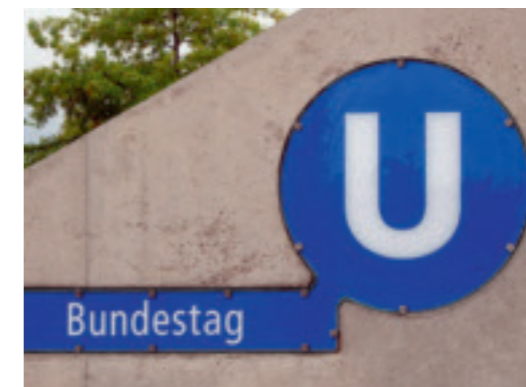
Nun ein Teil des großen Ganzen: der in den neunziger Jahren realisierte Bahnhof Bundestag

Noch gleitet man also am Bahnhof Museumsinsel mit gedrosselter Geschwindigkeit an einer Baustelle vorbei. Doch was zu sehen ist, reicht bereits, um Passagiere den Kopf heben zu lassen: ein ungewöhnlich starker Blauton erscheint