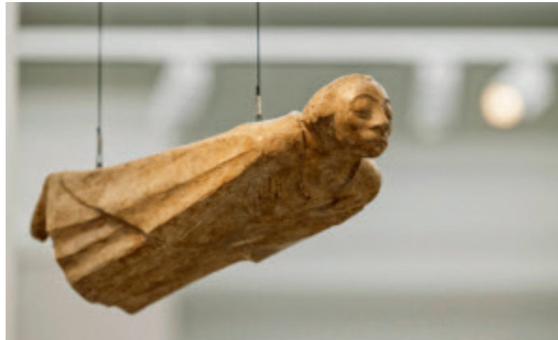
Bronzierter Gipsabguss des „Schwebenden“ von Ernst Barlach in der Dresdner Ausstellung.