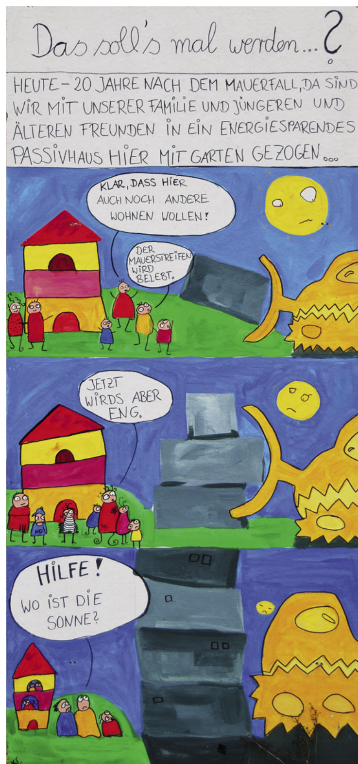
Handgemaltes Plakat am Zaun der Baugruppe „Living in Urban Units“ in der Schönholzer Straße 13–14 in Berlin.

Fotos: Doris Kleilein; Bebauungsplan 1–40: Senatsverwaltung für Stadtentwicklung Berlin