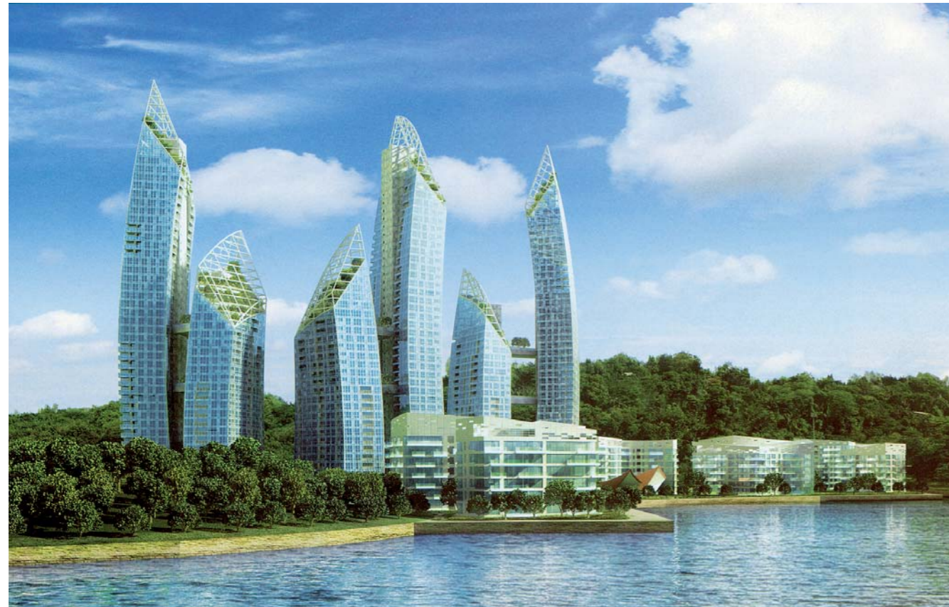
Keppel Bay International Ltd, Singapur

Bei der Bilder-Fundgrube der diesjährigen Immobilienmesse MIPIM in Cannes scheint die Interpretation von Hochhäusern als Gewächse am besten in die Zeit zu passen. Das Umdenken hin zum ökologischen Turmdesign ist nicht mehr aufzuhalten. Bei dem Ensemble oben handelt es sich um das Residence-Reflections-Project für die Keppel Bay am Keppel Golf Club von Singapur. Die Skyline-Mischung aus Sky-Suites im Wald und Villa-Styled Low-Rises am Wasser folgt der gewünschten Geschmacksbreite. Damit man sich in den steilen Steingärten der Turmköpfe wohlfühlt, geben gerüstartige Hauben zumindest optisch einen gewissen Halt. Es bietet sich an, dass sich die Türme nach der Sonne drehen und entsprechend der Nachfrage auch wachsen können. Hierzu waren aber bei Daniel Libeskind keine Hinweise zu finden.