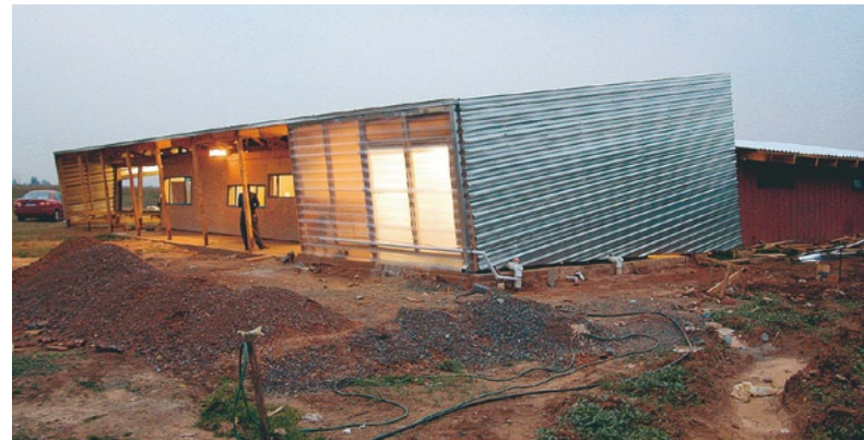
Die Tagesheimstätte „Modino o Moholo“ ist eins von zwei Gebäuden, die eine Gruppe von Studenten der TU Wien in Orange Farm südlich von Johannesburg gebaut hat. Beide Projekte werden in einer Ausstellung im AzW vorgestellt, parallel dazu zeichnet eine Bestandsaufnahme örtlicher Architekten ein Portrait der Stadtentwicklung mit all ihren Widersprüchen.