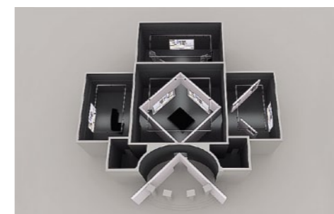
11 | Ausstellungsmodell