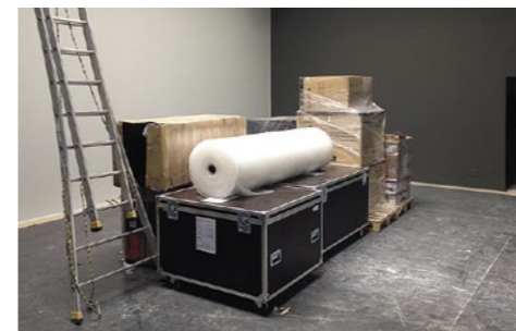
8 | 7. Mai 2014