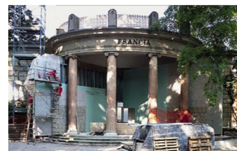
10 | 9. Mai 2014