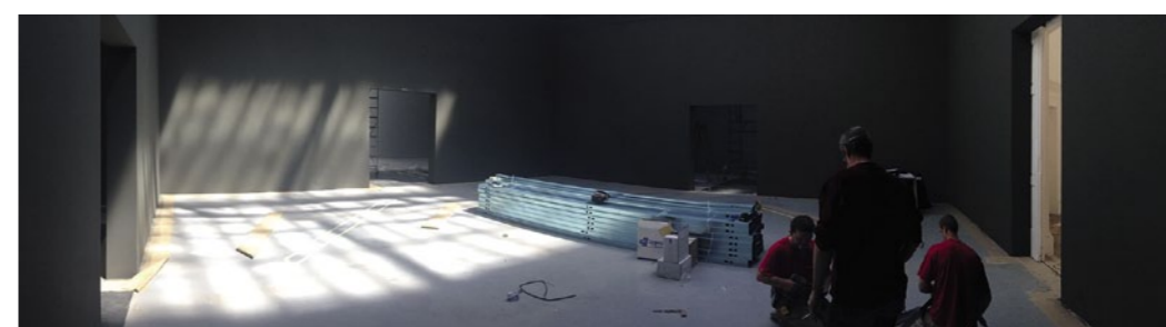
5 | 29. April 2014