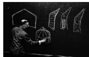
2 | Jean Prouvé