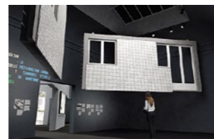
3 | Fertigteilelemente