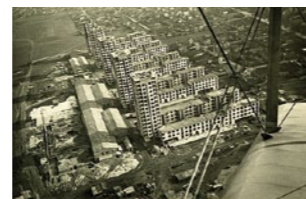
4 | Drancy

Tiere wie in einem Zoo gezeigt. Nun könnte es zum ersten Mal mehr wie ein Chor oder Orchester aussehen.