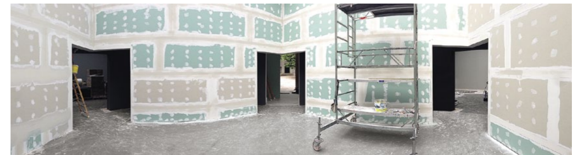
9 | 7. Mai 2014