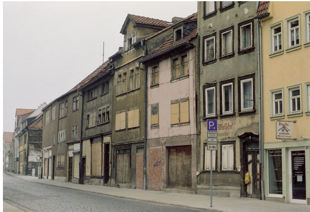
Anwohnerparken in der Schwabhäuser Straße in der Gothaer Innenstadt. Anwohnerparken?

Die Folge all dieser Widrigkeiten ist, dass der Verfall großer Altsadtbereiche und auch der Abriss wertvoller Bausubstanz weitergehen. Die Stadt Gotha kann man für diese Misere allerdings kaum verantwortlich machen. Unter den derzeitigen Rahmenbedingungen scheint eine Stärkung der Innenstädte vielerorts kaum machbar – trotz aller Bemühungen.