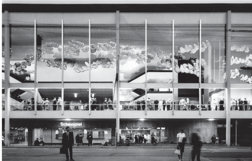
Oben: Blick ins grandiose Foyer des Schauspielhaus Frankfurt (1963) Unten: Dresdner-Bank-Hochhaus (1980)

Bundesbank, Schauspielhaus, Lufthansa-Wartungshalle, um nur einige zu nennen: Das DAM zeigt stadtbildprägende Frankfurter Bauten von Otto Apel und seinem Büro ABB