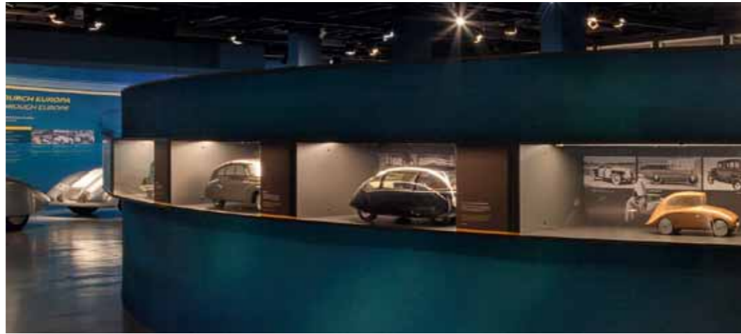
Blick in die Ausstellung

Was haben Stromlinienkarossen, historische Rennwagen und für Weltrekordfahrten entwickelte Motorräder mit dem Zeppelin-Museum zu tun? Zum einen entstand die vom Forum für Fahrzeuggeschichte konzipierte, rund 100 Exponate umfassende Ausstellung „Strom-Linien-Form“ in Kooperation mit dem Museum, zum anderen war Friedrichshafen ein Zentrum der Windkanalforschung in Deutschland.