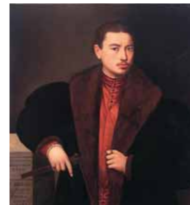
Sah Palladio so aus wie auf dem Gemälde eines unbekannt italienischen Malers, vermutlich aus dem 16. Jahrhundert? Oder wie der junge Mann auf dem Bild von Bernardo Licinio, datiert auf 1541? Authentische Porträts des Renaissance-Baumeisters sind beide Bildnisse nicht.

Man kennt die Architekten der Renaissance. Tizian hat 1537 Giulio Romano gemalt, Piero di Cosimo bereits ein halbes Jahrhundert früher Guiliano da Sangallo. Gegen Ende der Renaissance hat Paolo Veronese Vincenzo Scamozzi dargestellt, der ein Kapitell in Händen hält und der die Rocca Pisani entworfen hat, eine Villa nach dem Vorbild der Villa Rotonda von Andrea Palladio.