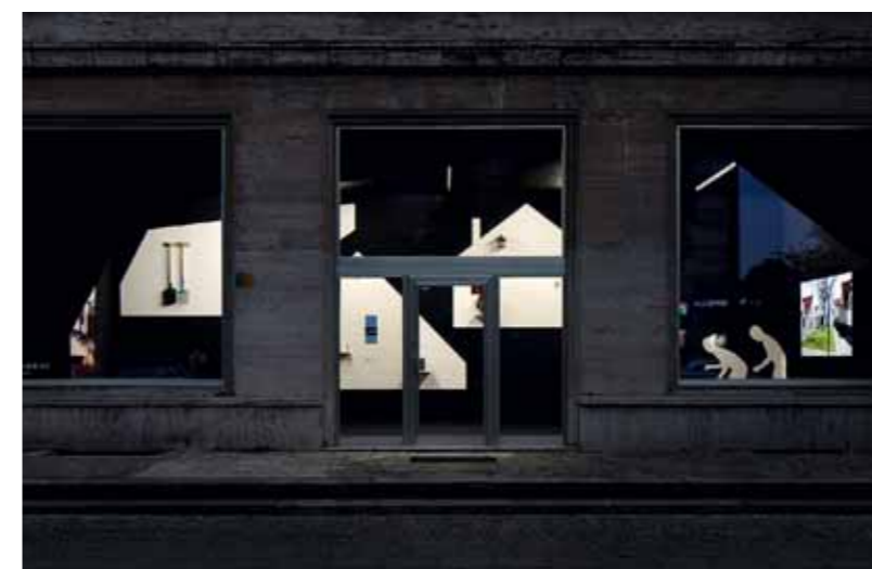
Das leicht finster Dräuende des Arrangements stimmt den Besucher darauf ein, dass auch ein Architekturfilm Thrill besitzen kann