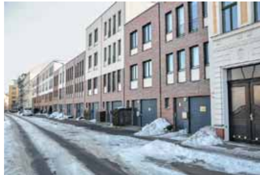
Fassaden, die den Passanten nur Garagentore, Briefkästen und Mülltonnenboxen zu bieten haben: von Arnold Bartetzky in Leipzig entdeckt