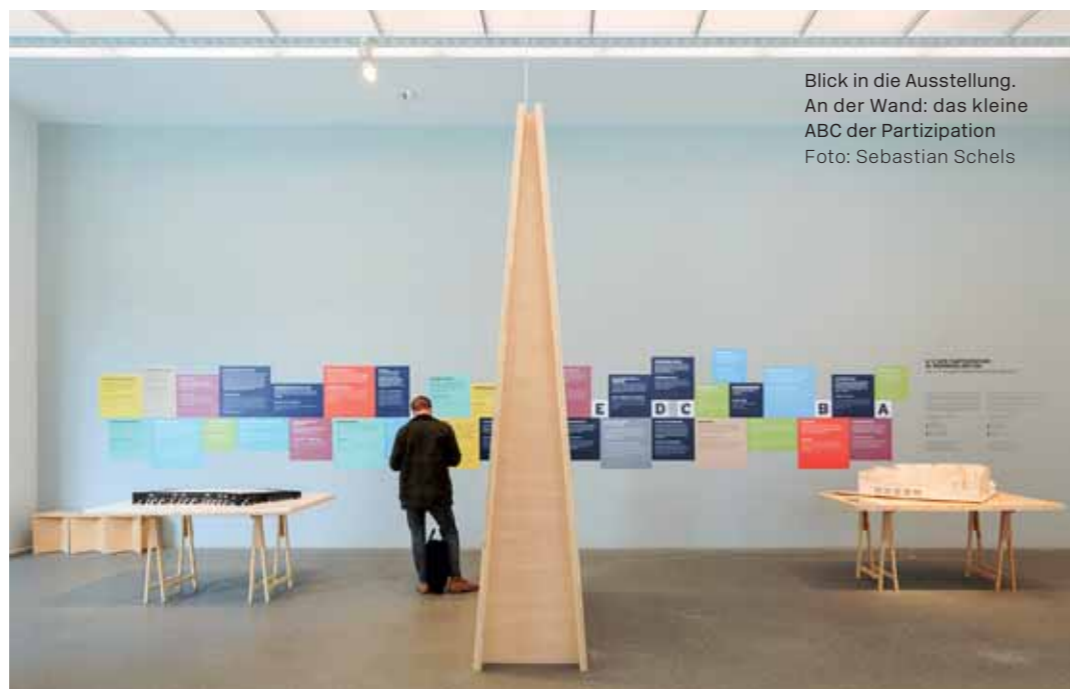
Blick in die Ausstellung. An der Wand: das kleine ABC der Partizipation

Alle Projekte basieren auf der Idee gemeinschaftlichen Zusammenlebens und einer sozial und kulturell geprägten Quartiersentwicklung. In allen Häusern gibt es große Gemeinschaftsflächen, von Grünbereichen und Dachgärten über Veranstaltungsräume, Werkstätten, Flexräume bis zu Clusterwohnungen mit einem Gemeinschaftsraum als Erschließung. Das Engagement der Bewohner ist unterschiedlich geregelt. Oft wird auf Freiwilligkeit und eine informelle Gemeinschaft gesetzt. Gleichwohl gibt es aber auch Motti, die die Bewohnerschaft als übergeordnetes Konzept formuliert wie „Selbermachen“ im Kraftwerk1 in Zürich, während bei den Wiener Projekten das Engagement für die Gemeinschaft verpflichtend ist. Dass Partizipation jedoch nicht nur bedeutet, mitzubestimmen (oder zu initiie-