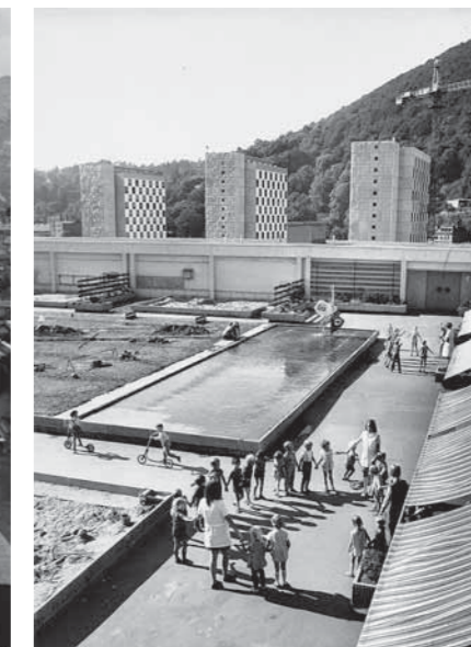
Zwei Dachkindergärten mit spektakulärer Aussicht stehen im Zentrum der Dresdner Ausstellung. Links: Fest auf dem Dach der Unité, Marseille, um 1960. Rechts: „Centrum“-Warenhaus in Suhl um 1970